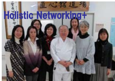
帯津三敬病院「直心会道場」にて 道着に黒帯姿の帯津良一先生と 道着の擦り切れ具合が50年の歴史を物語る。